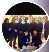
MINISTERIO DE MÚSICA: CRISTO REY